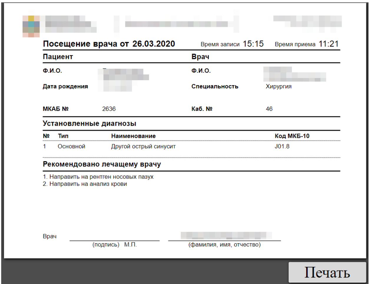
Рисунок 6. Форма заключения, открытая из меню записи